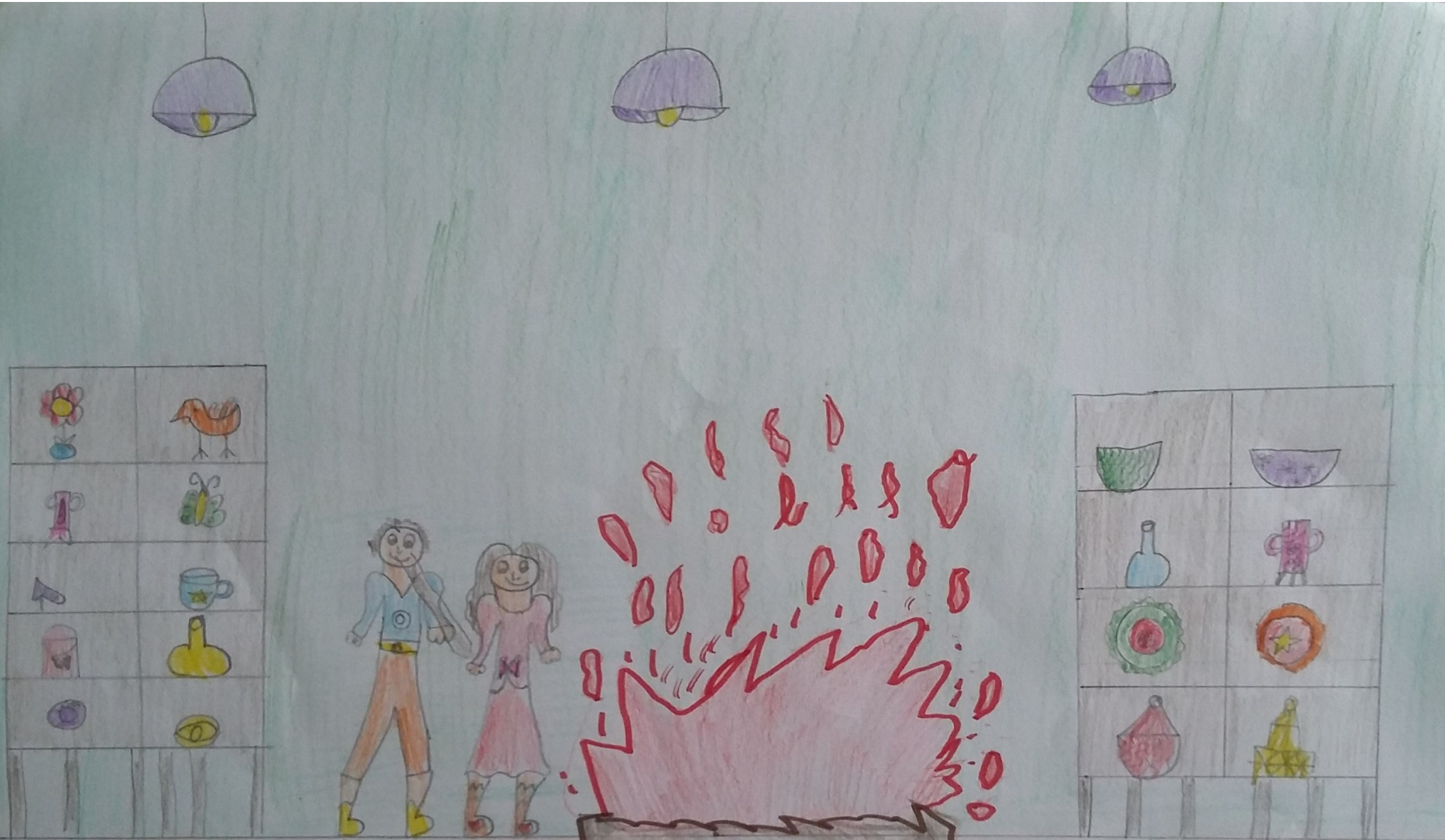
Дечак прави стаклену девојчицу, и она му постаје најбоља другарица.